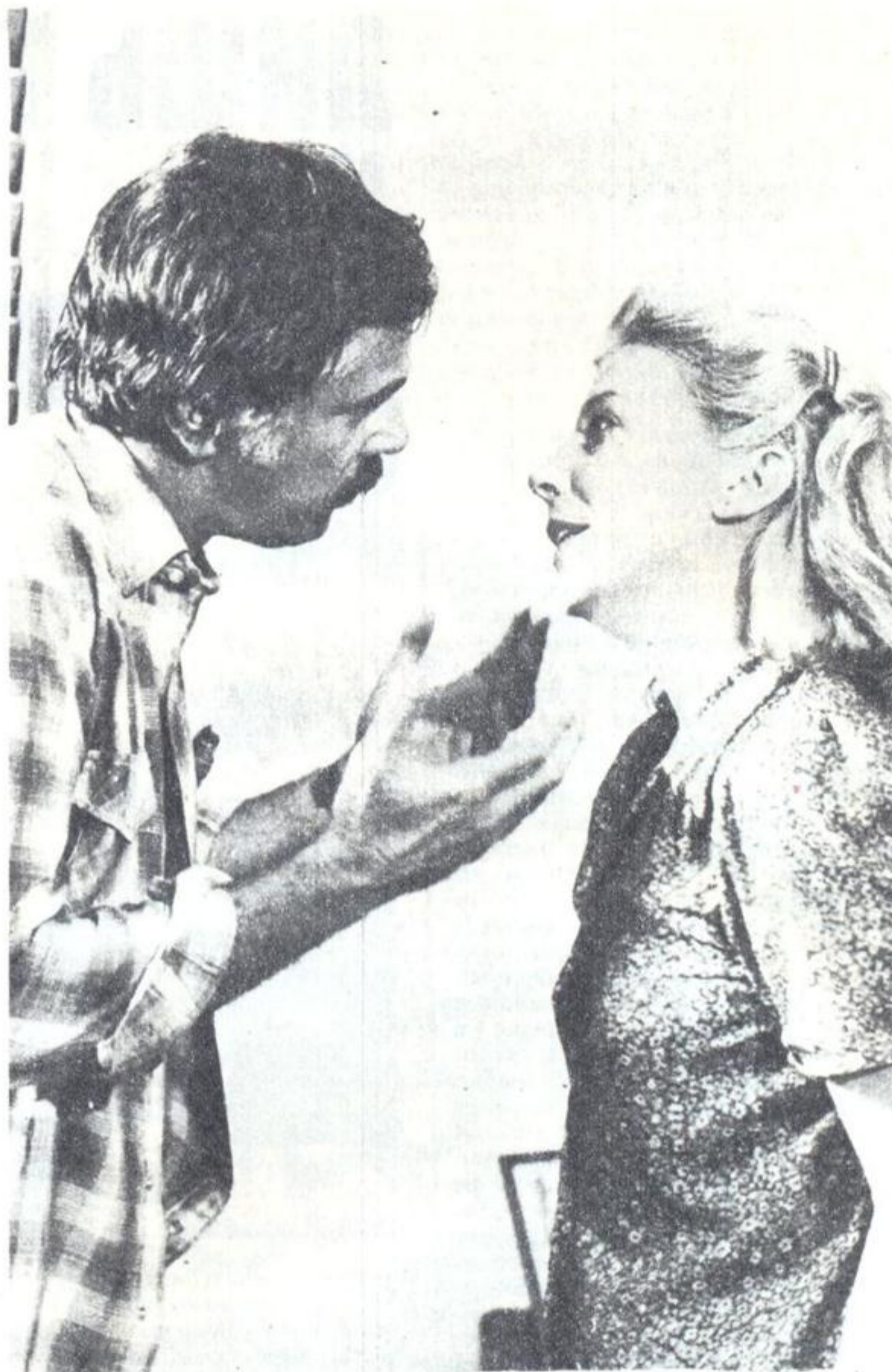
«До некоторой степени»

Заложники тоже вовсе не на одно лицо, не какие-то избранные люди особого склада, каждую секунду живущие в ожидании подвига. Есть тут и свои распри, и свои проблемы. Есть роковой