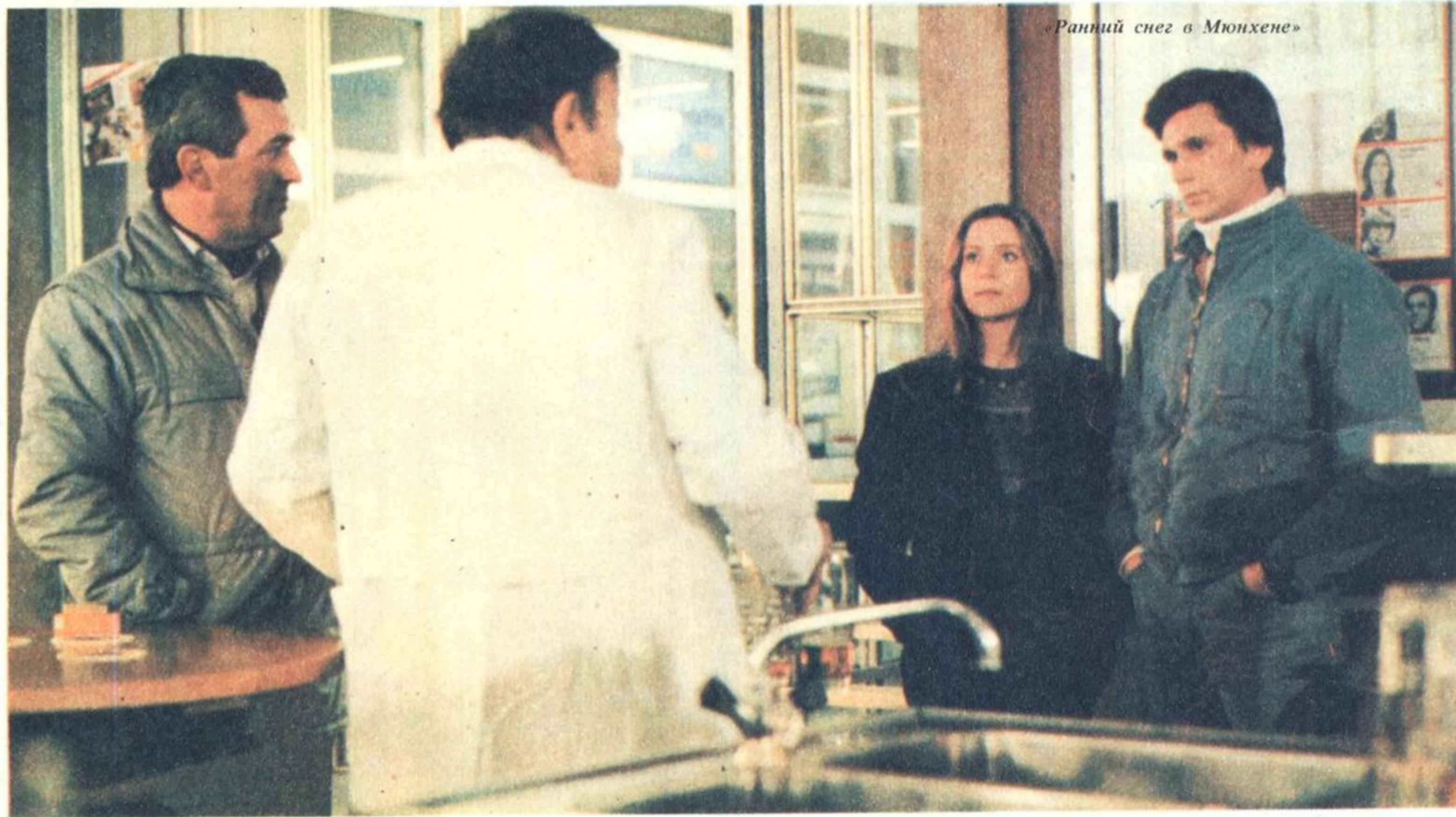
«Ранний снег в Мюнхене»

Знакомьтесь: Оскар, процветающий кинодраматург. На сцене с огромным успехом идет его пьеса, в кинотеатрах огромные очереди на его последний фильм. Режиссер Артуро торопит приятеля с новой работой: надо быстренько «состряпать» лихую картинку, например, о женском равноправии. А Оскар, который всегда с легкостью поучал зрителя, выдавая ему готовые решения о поведении в стандартных ситуациях, встретился с Линой, учетчицей из порта, и впал в отчаяние. Он совершенно поражен ее полным ощущением свободы и независимости, умением строить свою жизнь самостоятельно и не терять человеческого достоинства ни в какой ситуации. Сценарий разор-