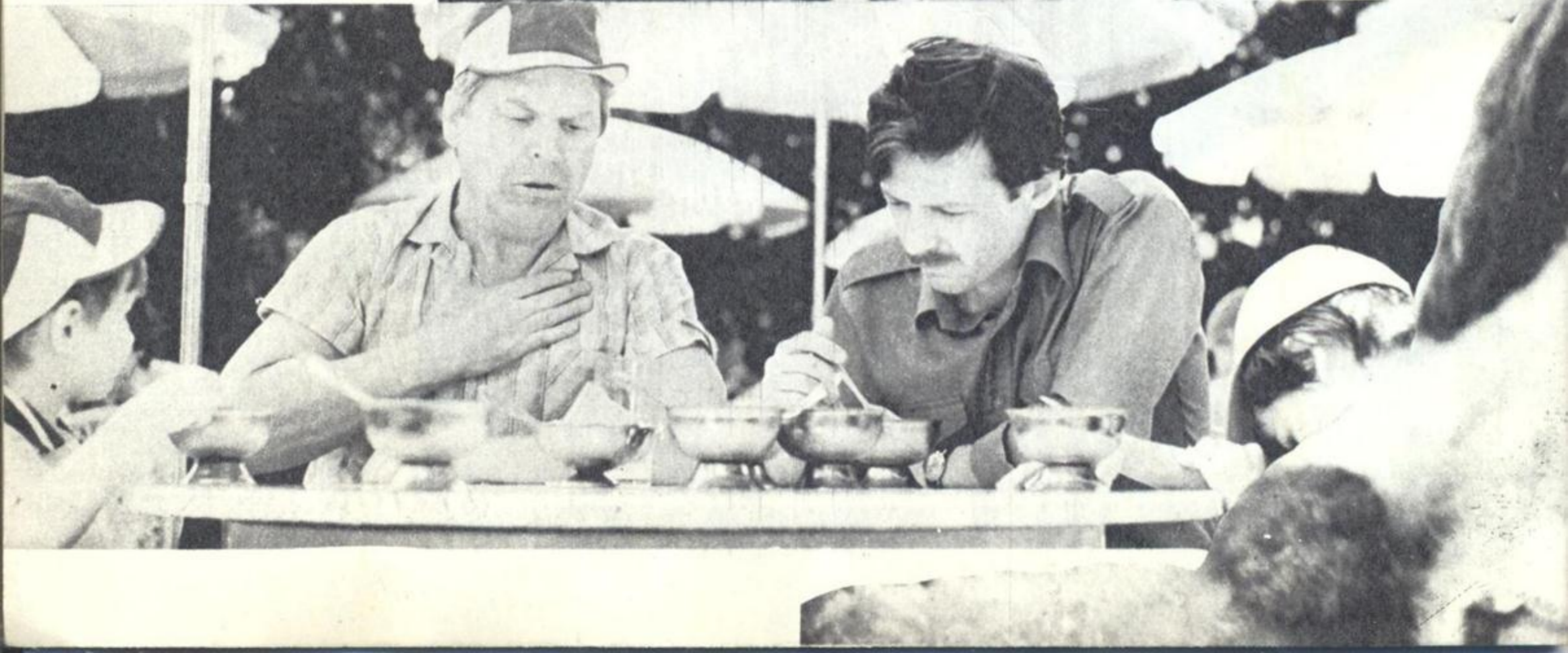
мужчина — арт. Михаил Кокшенов